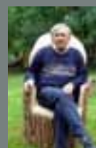
Frêne, H 150, diam 60, 120kg